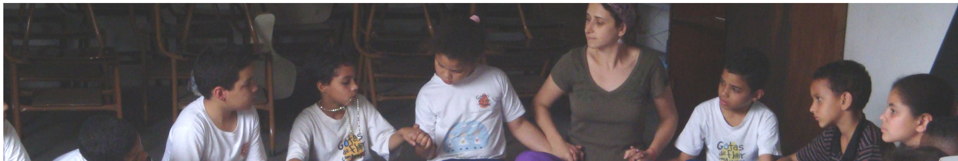
Captação de Recursos